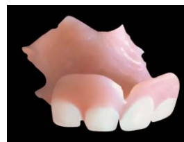
Snímateľná detská náhrada